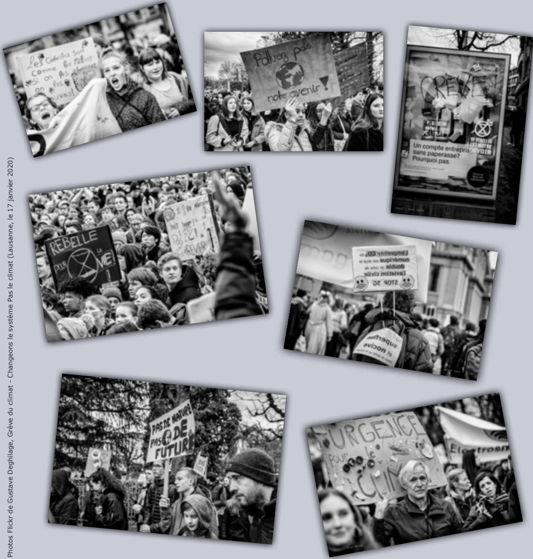
Grève du climat - Changeons le système Pas le climat (Lausanne, le 17 janvier 2020)